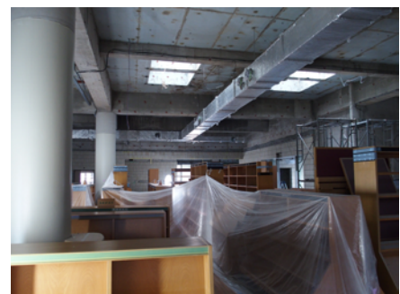
天井は剥がされています