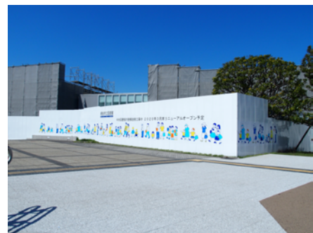
ラウンジ付近の仮囲い