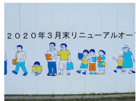
座り込んで本を読む男の子も