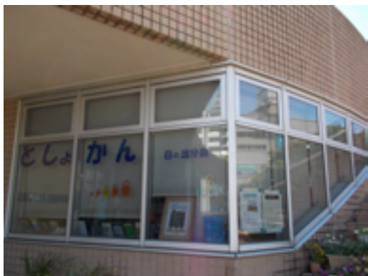
外から見ると「としょかん」の文字が