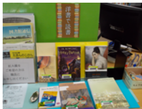
カウンターの展示。洋書もたくさん置いています。