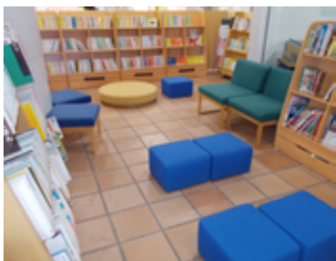
公民館ロビーに設置したオープンスペース。